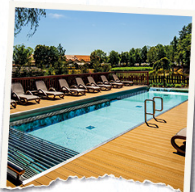
2 BASENY Z PODGRZEWANĄ WODĄ