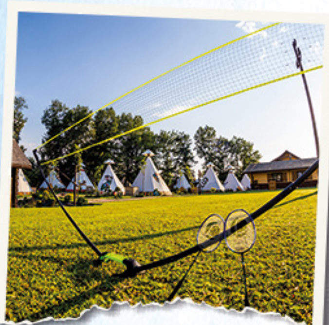
BOISKO DO BADMINTONA