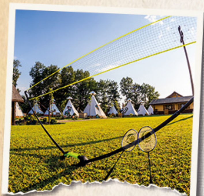
BOISKO DO BADMINTONA