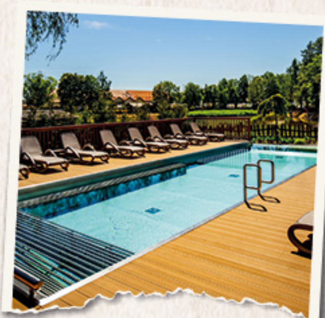
2 BASENY Z PODGRZEWANĄ WODĄ